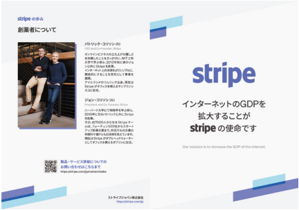
■ブローシャー/B5/8P 表1・表4